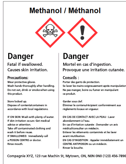
Étiquette du fournisseur SIMDUT 2015