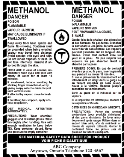
Étiquette du fournisseur SIMDUT 1988